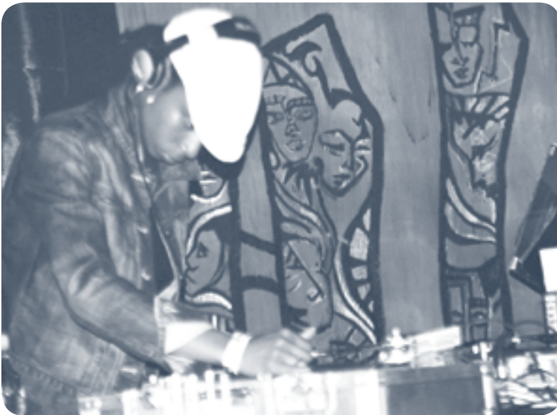
She Spins 2

Desarrollo, reconocimiento de otras comunidades, Emociones y sentimientos, Sentido de pertenencia, Impacto-Conciencia social, Cambio-Innovación, Arte. Las categorías emergentes fueron Inconformidades sociales y Estereotipos sociales.