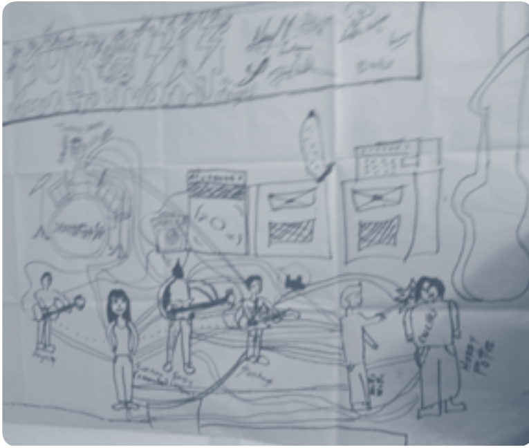
Fuente: ejercicio cartográfico con un integrante de la comunidad de los metaleros de la banda Mukoosis.

En este segundo ejercicio de cartografía encontramos las relaciones que tienen los integrantes de la banda de metal Mukoosis, en que se reconocen los unos a los otros, su propia actividad y el contexto en el que se preparan.