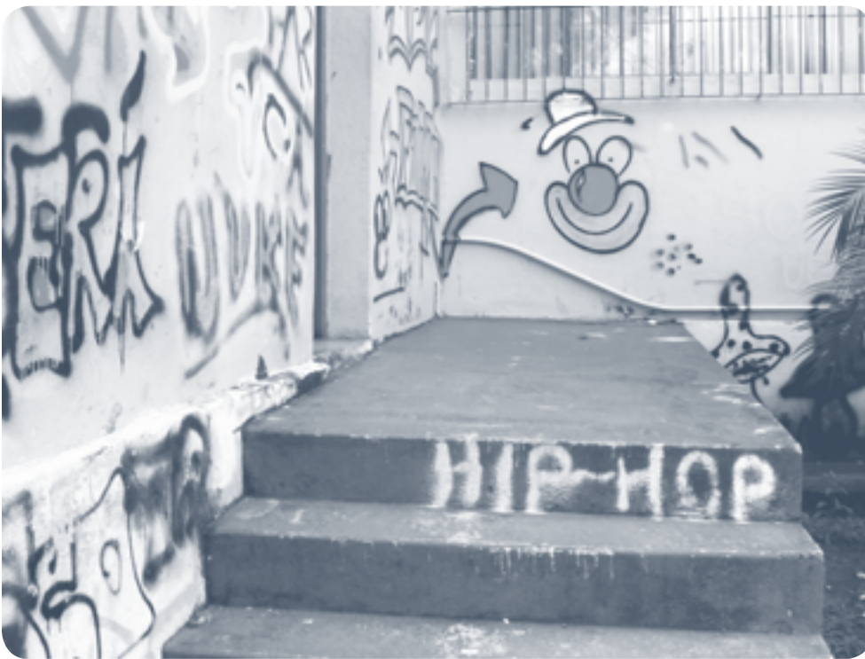
Graffiti in my university

Hay mucho por descubrir en cada localidad de esta gran ciudad: muchas personas y colectivos aportando cambios a sus comunidades a partir de actividades culturales que podrían integrarse para dar solvencia a problemáticas mucho más grandes y que generen un impacto a nivel distrital.